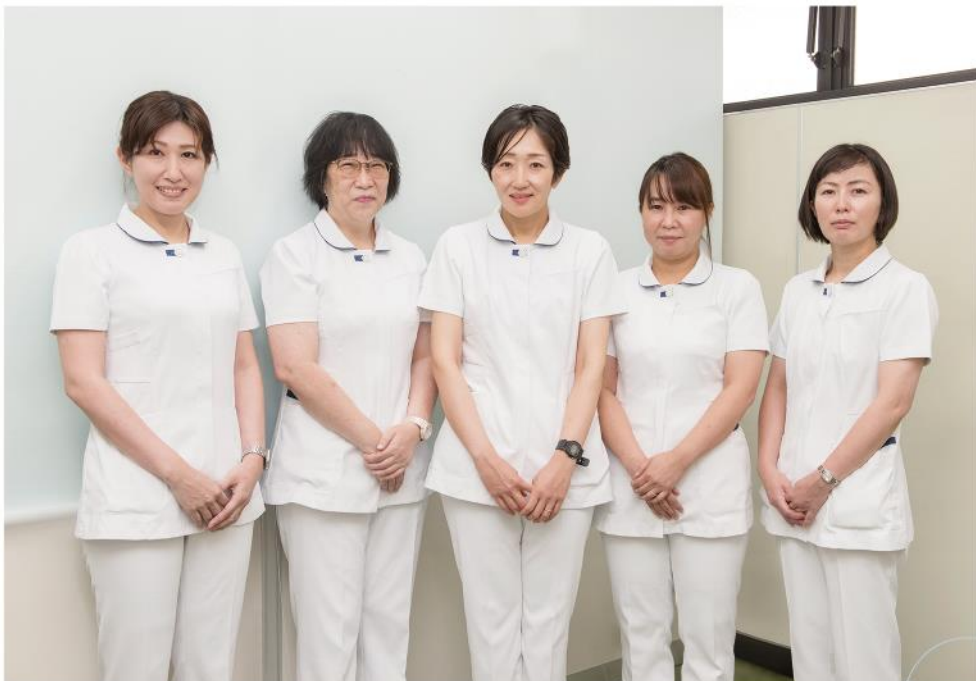
京都九条病院 外来看護師(救急外来担当)