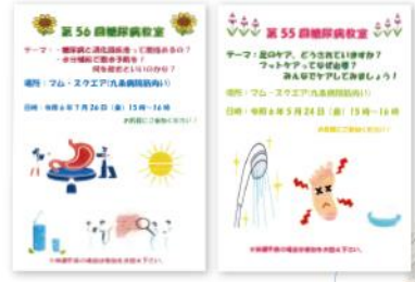
♪興味のある方、奮ってご参加くださいね！ 心よりお待ちしております♪