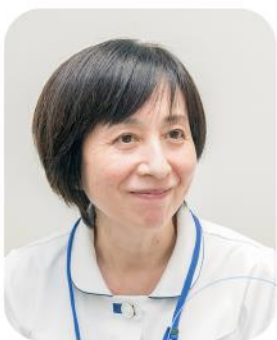
京都九条病院 看護部 課長

救急外来では、気分が悪いと運ばれてきた方が検査をしてみると実は心不全を発症していたり、腰痛を主訴にいられた患者さんが実は内臓の病気だったというようなことがあります。そのため外来看護師は、救急看護の知識・技術の勉強会や、症例を振り返って検討するなど普段から学習を重ねています。今では全員の看護師が救急に携わり、救急要請が入ると「次私が担当します。」と自主的に手を上げて実力を発揮してくれています。