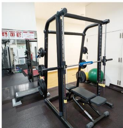
トレーニングマシンで汗を流す時間は、爽快なひとときです。筋肉が心地よく疲れ、汗が流れるたびにストレスが解放されていく感覚がたまりません。