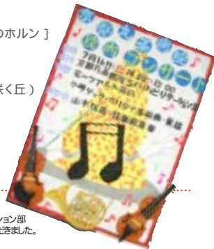
ポスターはハピレーション部作業療法にて作っていただきました。

もある山木院長の、京都九条病院で入院中の患者さんや外来の患者さん、そのご家族に、質の高い本場のクラシックを聴いてもらいたい、そして音楽の素晴らしさを感じてもらいたいという長年の夢が実り、実現したものです。今回、ボランティアでの出演を快く引き受けてくださったのは院長の所属するオーケストラのメンバー。バイオリン2人、ピオラ1人、チェロ1人、ホルン2人の編成で、全員が他に仕事を持つアマチュアグループですが、それぞれ長いキャリアがあり腕前はプロ級。このコンサートを開くにあたっては、忙しい仕事の合間を縫って練習を重ね、準備をしてくださったそうです。病院の職員もポスターを作ったり、会場整備をするなどさまざまな支援を行いました。その甲斐あってコンサートは大成功。演奏後にはアンコールの手拍子がわき起こり、多くの方から美しい音楽に心癒されたという感想が寄せられました。