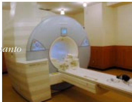
MAGNETOM Avanto マグネトム アバント

京都九条病院ではこれまで、最高の技術で最高の治療を提供する「e」をモットーに、漸次検査機器の刷新を図ってきましたが、さらに検査精度を高め、また、より「患者さんに優しい」検査を実現するため昨年1月、MAGNETOM Avanto（シーメンス社製）を京都で初めて導入したのに続き、今年7月にはマルチスライスCT Aquilion 16（東芝社製）を、10月には世界最新の血管撮影装置 AXIOM Artis d FA（シーメンス社製）を導入いたしました。