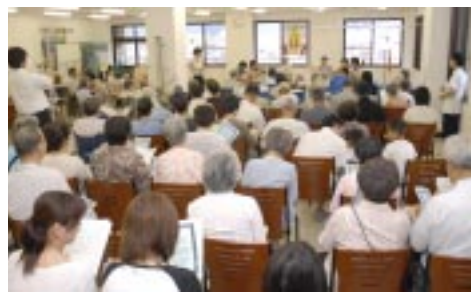
会場のみなさまとの合唱風景