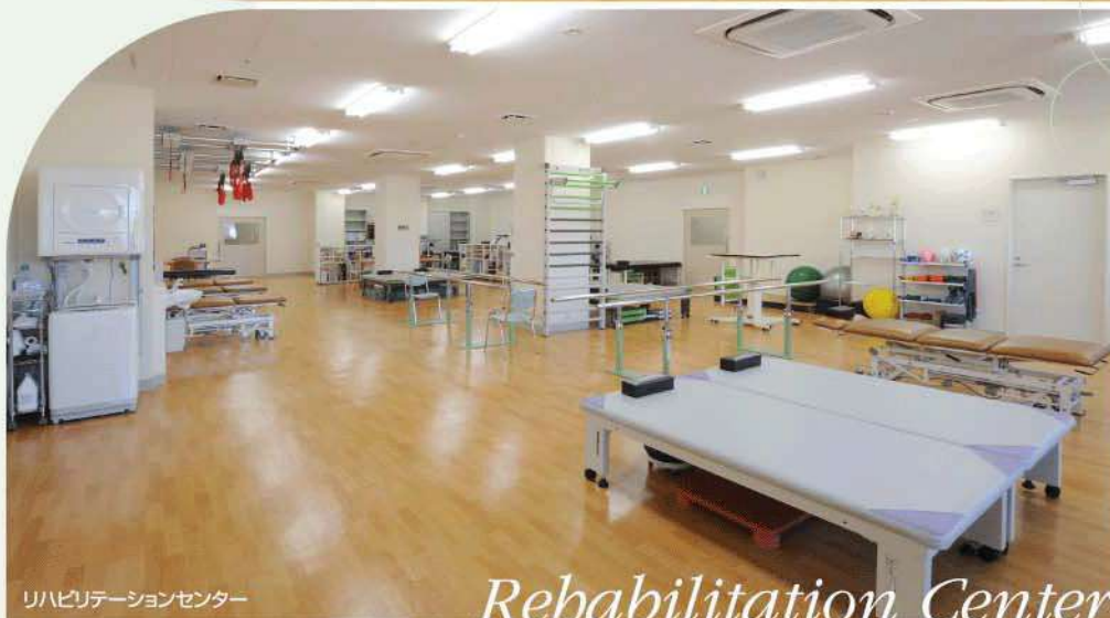
リハビリテーションセンター