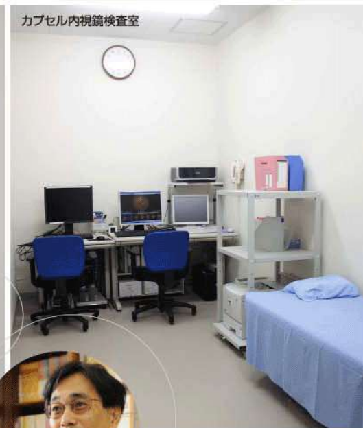
カプセル内視鏡検査室