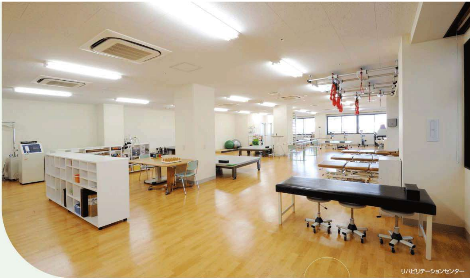
リハビリテーションセンター