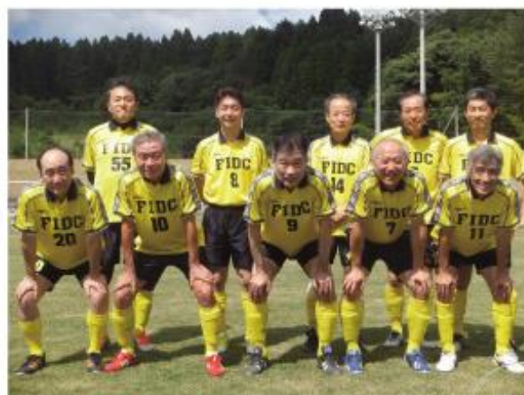
OBチームのメンバーと共に楽しく、また時には軽くグラウンドを駆け回っています。