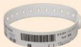
ID番号記載リストバンド

一つ目は、安全確認3点認証システムです。注射(点滴)や輸血の実施時に看護師がパソコンをベッドサイドに持ち込み、専用の器具でバーコードを読み取るようになりました。①リストバンド、②注射ラベル、③電子カルテシステム、3点の情報を照らし合わせ、患者さまに正しい内容の注射が正しい日時に実施されるよう確認する仕組みです。一か所でも違えば電子カルテ画面に「×」が表示されます。看護師は「○」の表示を確認しない限り実施しません。外来での化学療法や輸血も同じです。これまで通り目でも確認しますが、ご理解、ご協力をお願いいたします。