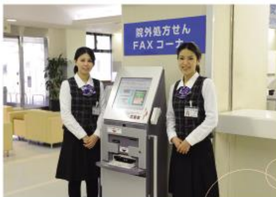
不明点等ございましたら、各機械ごとに総合案内(ゲストリレーション)が付いておりますので、操作は全ておまかせください。

このシステムにより、会計の待ち時間がぐっと短縮されるのに加え、「会計表示機」に会計準備が出来ている方々の番号が表示されていますので、窓口で確認