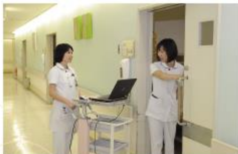
各病室のベッドサイドまで電子カルテを移動することで、患者さんお一人おひとりの状況把握した看護において役に立っています。

看護スタッフが病棟で看護を行う時も、ベッドサイドにパソコンを持って行き、測定した血圧や体