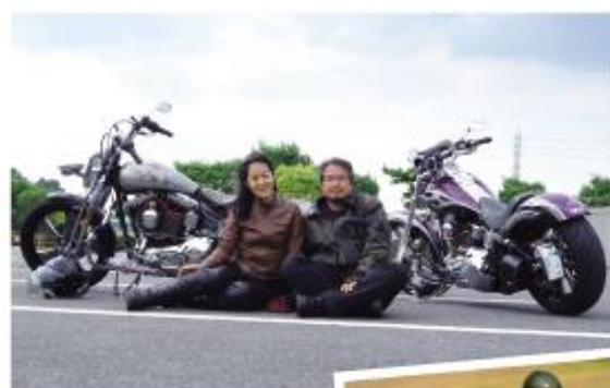
ライダー仲間とのツーリングに夫婦で参加した時の1枚とサーキット走行時の1枚。愛車とともにゆったりと風を感じながら、時には風を切りながら走るひときは、私にとって大切な時間になっています。