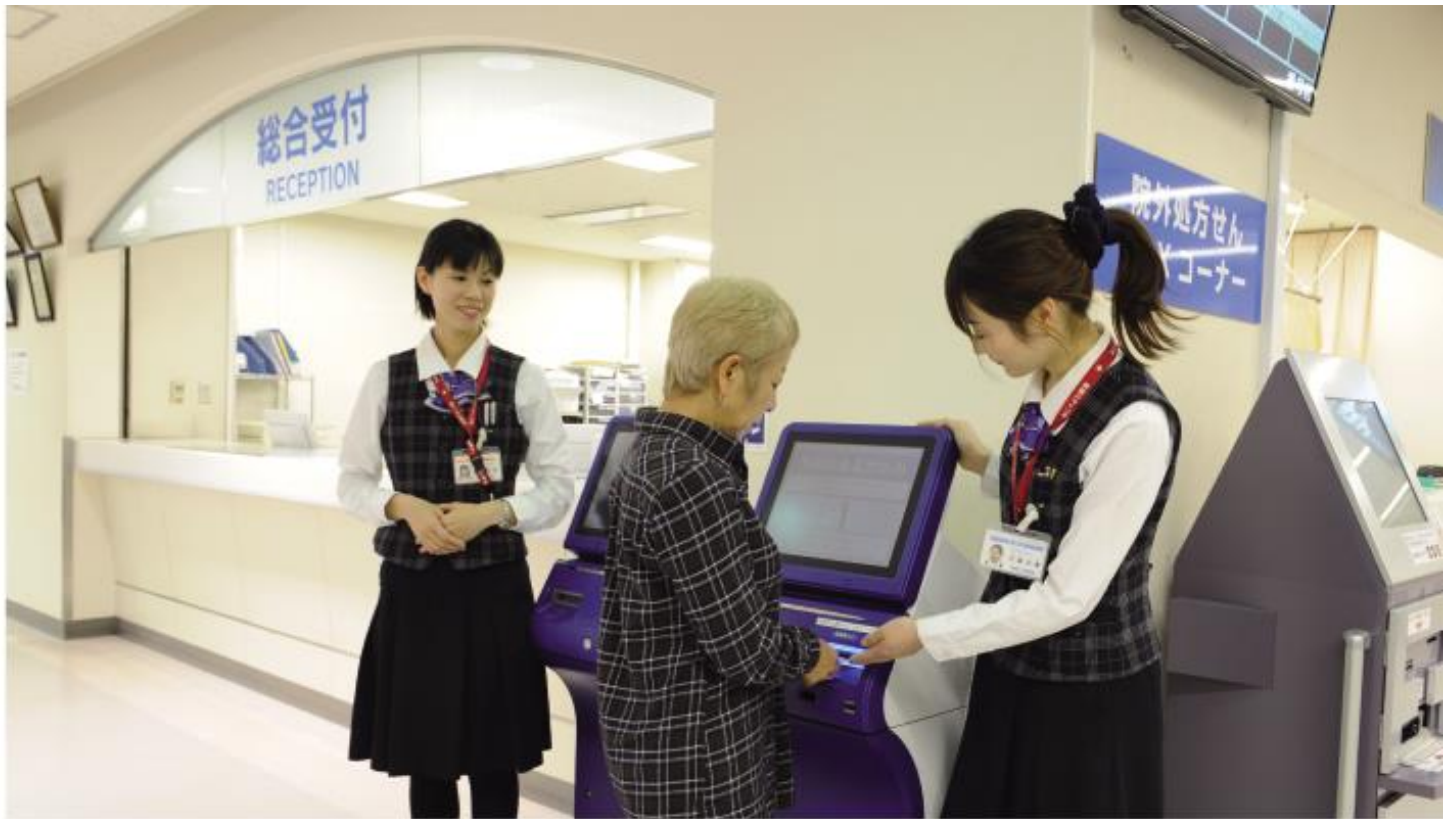
正面玄関を入ってすぐに設置された「自動再来受付機」は、タッチパネルで受付操作も簡単。