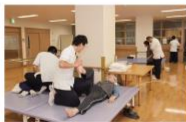
個別リハビリテーション

当施設のセールスポイントの二つは、全100床のうち約半分が、個人の生活スタイルを尊重する独立型の個室となつて居ることです。プライバシーが気になる、他の人と同室だと気兼ねしてしまうといった方にも安心してご利用いただけます。「シングルタイプのホテルのような感覚で過ごせる」と好評です。