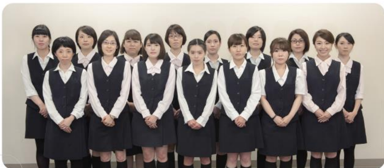
◎ 医師事務作業補助者