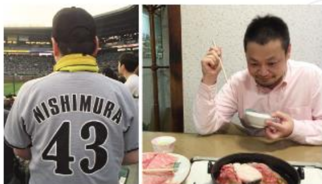
甲子園での観戦とお肉の食べごろを待つ私。どちらも無意識のうちに熱い眼差しになってしまいます。