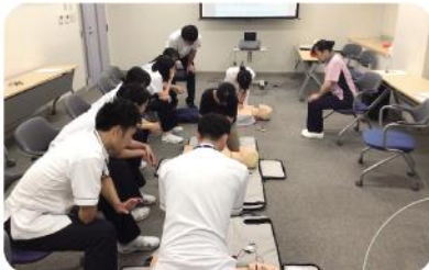
京都九条病院内での講習・指導の様子