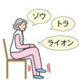
1 足踏みをしながら動物の名前を言う