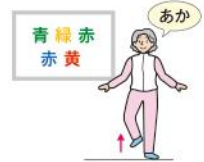
4 片足立ちで文字の色を答える

だけ早く足踏みをする」など簡単なものが採用されます。認知課題は、「動物や野菜花の名称」や「100など特定の数字から7を繰り返して引く計算課題」などが多く、運動課題中に認知課題の答えをできる限り数多く回答できるように意識します。足腰に自信のある方は、「踏み台昇降」や「片足立ち」などの運動課題