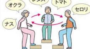
3 野菜の名前を言いながら踏み台昇降