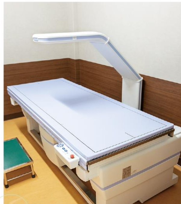
新しく導入した骨密度測定装置。仰向けに寝た状態で、背骨・大腿骨の2カ所を測定します。

身体能力が低下し移動がしにくくなる状態をロコモティブシンドローム（ロコモ）と言います。このロコモになる原因の三大疾患は、骨粗鬆症、変形性膝関節症、脊柱管狭窄症です。もちろん、骨粗鬆症にならないよう骨密度を上げることは大切ですが、それだけではロコモを防ぐことはできません。ロコモにならないためには、まずよい姿勢を保つ必要があります。膝、股関節、脊椎といった運動