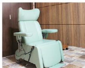
電動リクライニングチェア