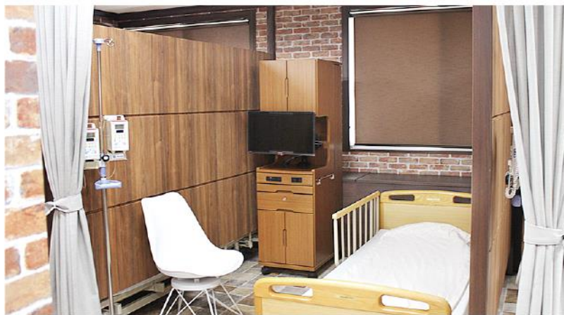
パーティションで仕切られた各治療スペース