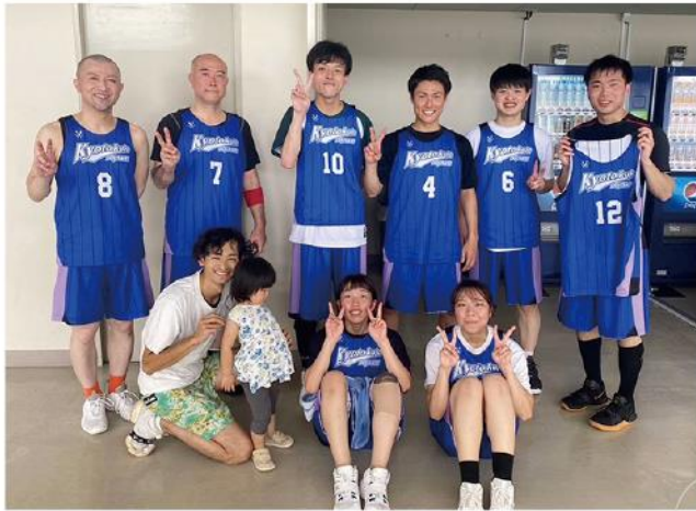
いつも一緒に汗を流すバスケットボール部の皆さん。

肩関節を中心に骨、関節、筋肉、靭帯などの疾患全般の診療に当たっています。薬物療法や運動療法などそれぞれの症状、ニーズに合った治療法を提供し、地域の皆さんの健康に貢献すべく務めていますので、運動器に問題のある方、不安のある方はご相談ください。