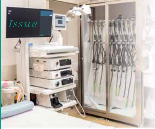
京都九条病院 消化器内科診療室