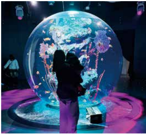
水族館「アトア」の幻想的な空間に、子どもすっかり夢中になっていました。